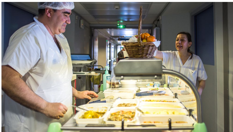
Les patients en long séjour se font servir par des aides-soignants dans le couloir, selon leurs goûts, avec un chariot « maître d'hôtel ». De quoi enthousiasmer les patients : « C'est génial, votre système ! », « Beaucoup plus appétissant que dans les petites barquettes »,... Et leur rendre leur humour : « vous avez oublié l'apéro ? »...